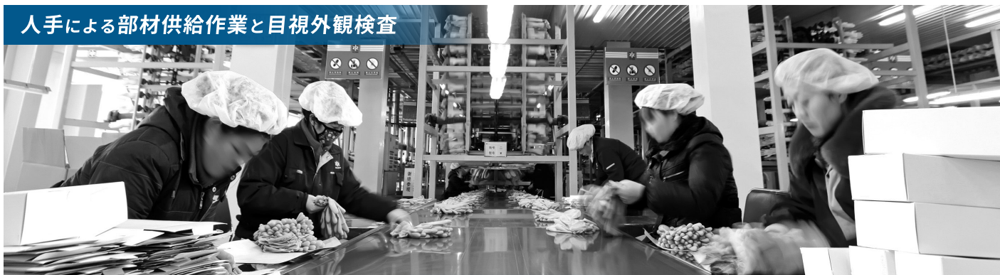
人手による部材供給作業と目視外観検査