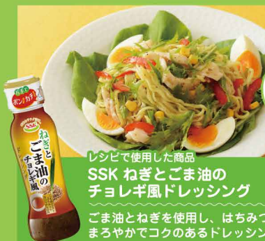
レシピで使用した商品 SSK ねぎとごま油のチョレギ風ドレッシング